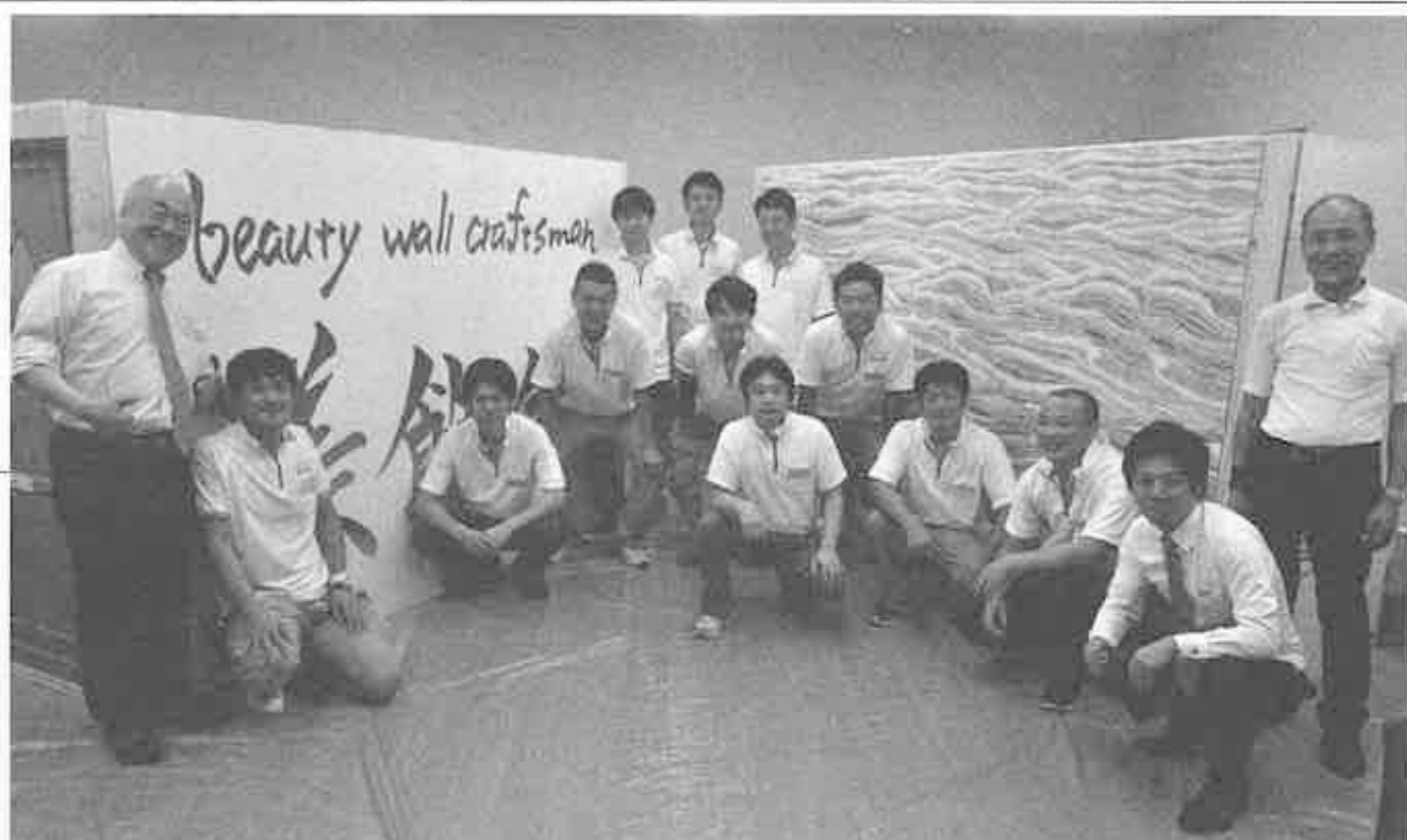
会場に設置・施工されたデジプリ壁紙を背景に参加者の集合写真

小島氏は、まず初めにインクジェットシステムの詳細を説明、出力方式は、「オンデマンド型」が主流でメーカーによって